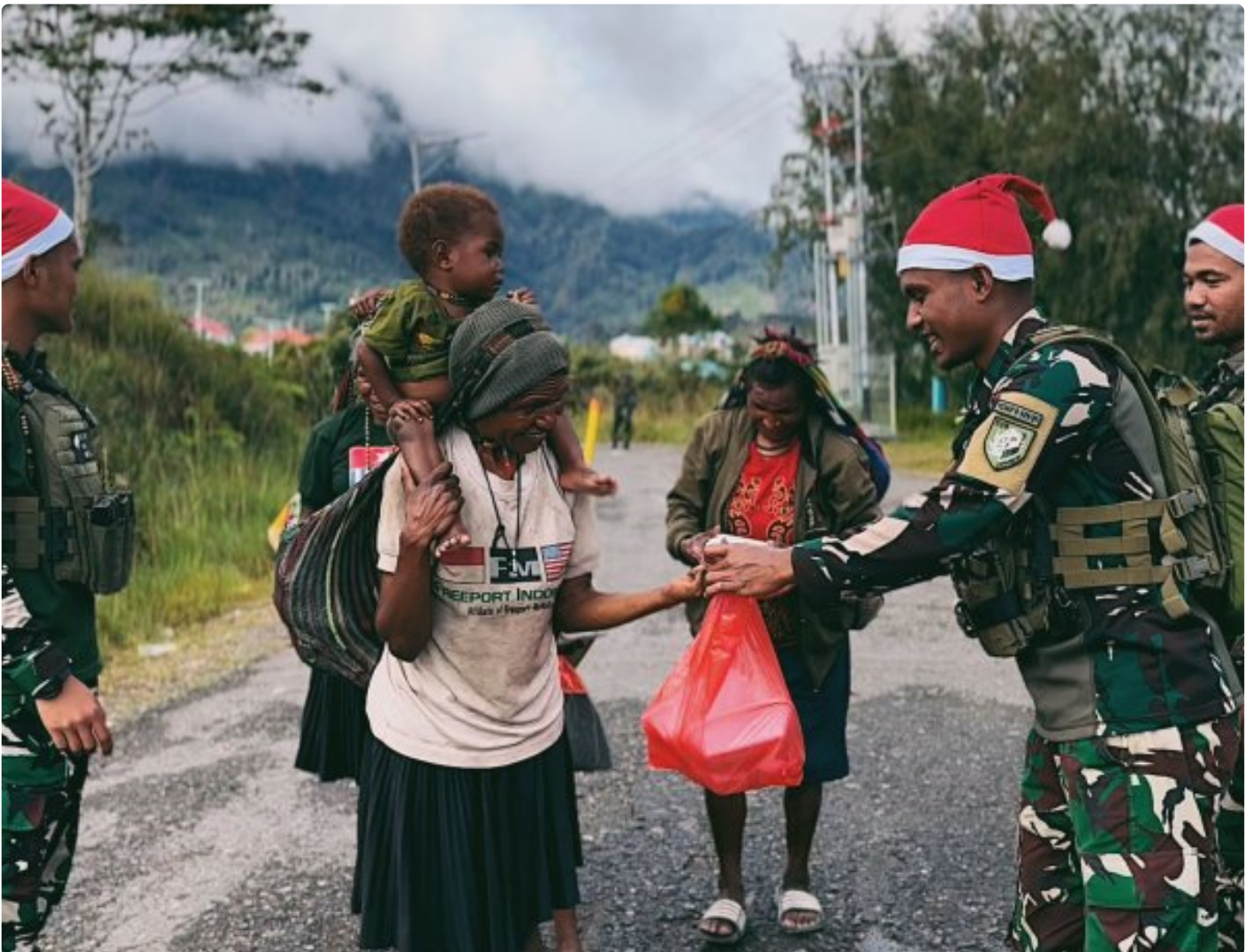
Foto: Satgas Yonif 509 Kostrad memberikan makna baru pada patroli keamanan dengan berbagi kebahagiaan bersama masyarakat di Intan Jaya, Papua.

PAPUA- Dalam balutan semangat Natal yang damai, Satgas Yonif 509 Kostrad memberikan makna baru pada patroli keamanan dengan berbagi kebahagiaan