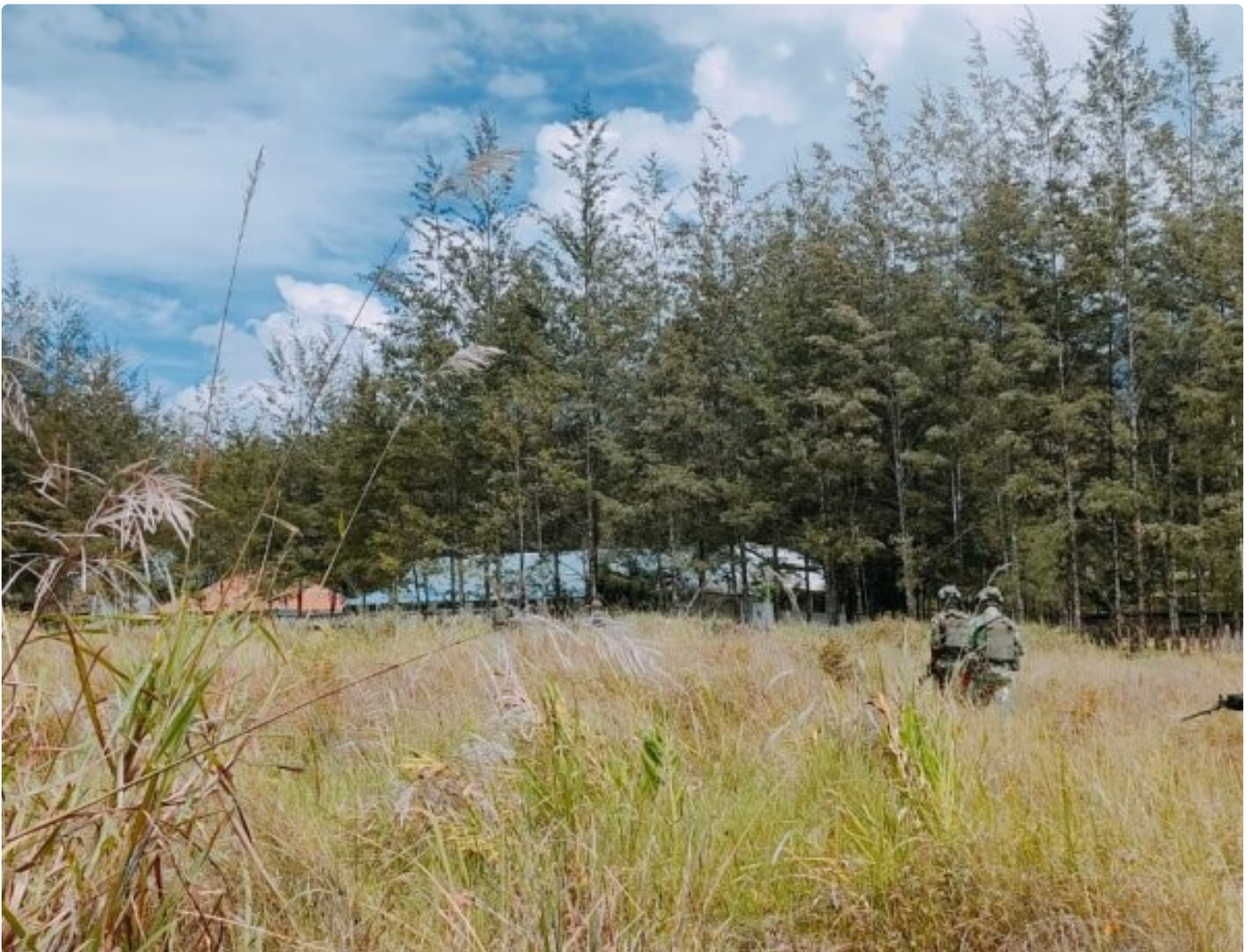
Satgas Yonif 323 Amankan Anggota OPM terduga pelaku tindak Kriminal

Satgas Mobile Yonif 323/Buaya Putih Kostrad berhasil menangkap salah satu anggota Organisasi Papua Merdeka (OPM) yang diduga terlibat dalam sejumlah